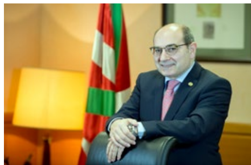
Jon Darpón Consejero de Salud del Gobierno Vasco

El 35 aniversario de Osakidetza, es una magnífica oportunidad de poner en valor todo lo que hemos conseguido gracias a la confianza y aportación de la sociedad vasca y a la labor conjunta de miles de profesionales que han dado lo mejor de sí. Pero sobre todo, debe servir para mirar hacia adelante y anticiparnos a los retos que nos depara el futuro. Solo de ese modo estaremos sentando las bases sólidas para que dentro de otros 35 años, Euskadi pueda seguir sintiéndose orgullosa de su sanidad pública.